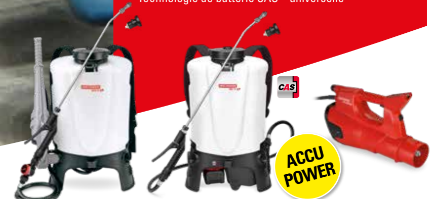
Pulvérisateur à dos RPD 15*